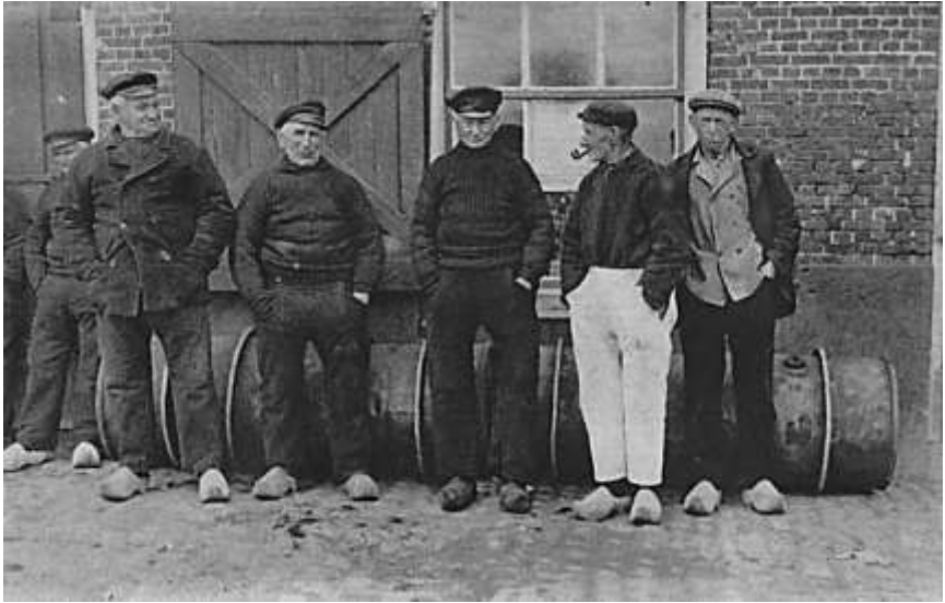
De oude garde van Arнемuiden.....