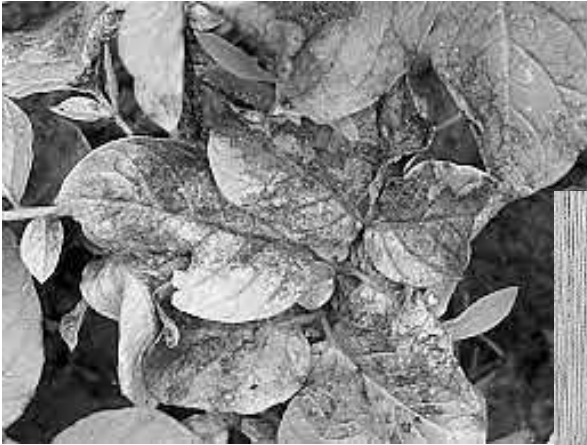
Door de aardappelziekte aangetast blad en knollen.