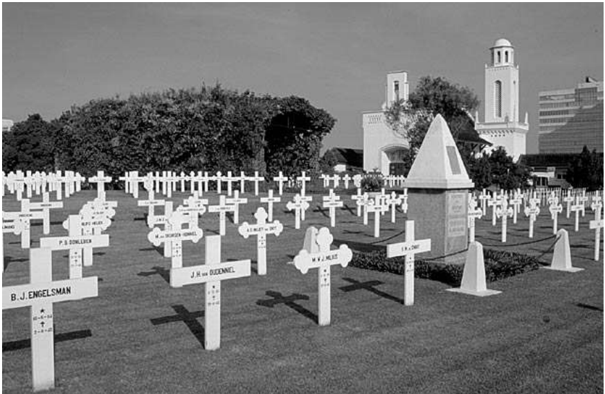
Het Nederlands ereveld Menteng Pulo te Jakarta op West-Java telt ongeveer 4.300 graven.

In dit nummer nog een aanvulling op het artikel over de typhusbarak, oorlogsslachtoffers in Nederlands-Indië en een artikel over armoede en hongersnood in de Bommelerwaard.