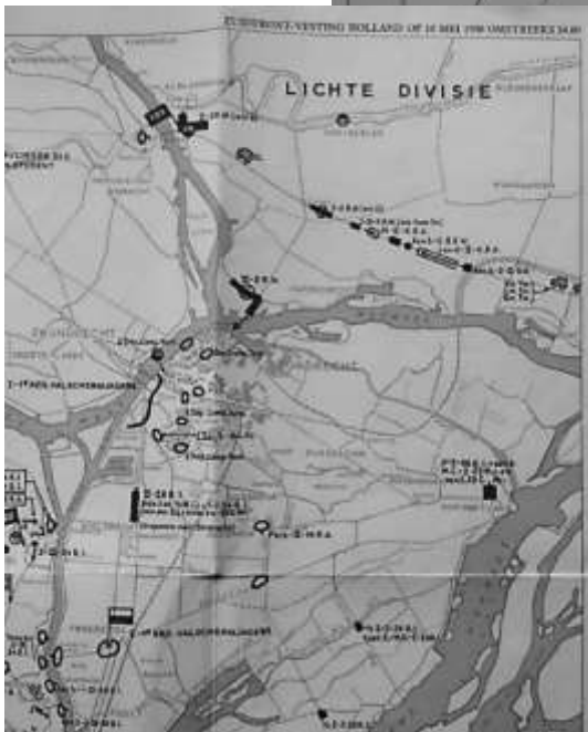
Schetskaarten nr. Z 5 en 6, situatie van de Lichte Divisie op 10 mei 18.00 en 24.00 uur.