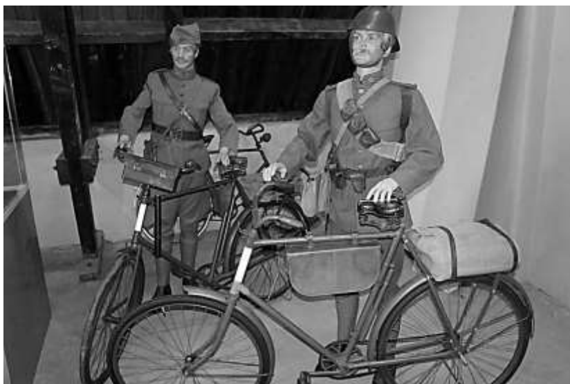
Fietsen van het RW in de Isabellakazerne in 's-Hertogenbosch.