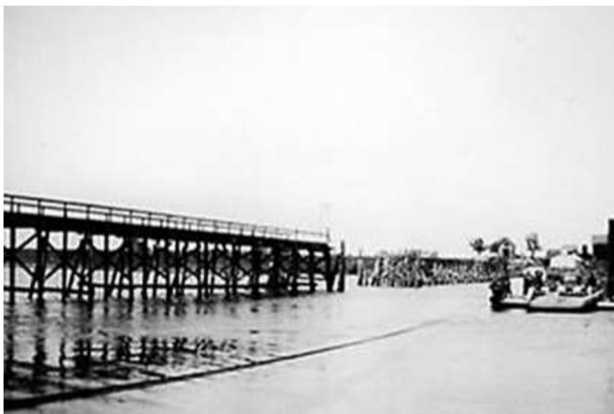
Jukbrug bij Drongelen.

Willem van der Zalm woonde als tienjarig jongetje aan het eind van de Liesveldsesteeg en zag met eigen ogen de soldaten met heel hun hebben en houwen op de Papatientdijk staan, de Belse paarden trokken het zware materiaal en de keukenwagens. De colonne stond te wachten om de sloopbrug over te trekken die aan het eind van de Ovendam met de Herwijjnse kant was verbonden. Het waren gevorderde schepen die met balken en planken aan elkaar gemaakt waren. In het midden konden de schepen van 60 tot 80 ton, er tussenuit gevaren worden om de scheepvaart door te laten gaan. Naderhand werden de balken weer binnendijs opgeslagen en werden ze door Duitse soldaten bewaakt. Uiteindelijk vond het hout gretig aftrek bij de Brakelse bevolking. Bij het wachten voor de sloopbrug waren er zelfs Brakelse soldaten die, voordat ze over de brug trokken, nog even naar huis gingen om de familie te begroeten. Willem heeft ook nog gezien dat de Nederlandse soldaten met verouderde geweren op de overvliegende Duitsers schoten, zonder resultaat uiteraard. Op een gegeven moment werd er geroepen “laat die burgers weggaan”.