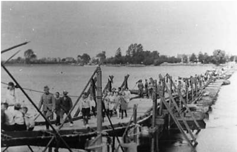
Pontonbrug tussen Brakel en Herwijnen.

Na de inval van het Duitse leger op Nederlands grondgebied op 10 mei 1940 trok een onderdeel van de Lichte Divisie uit Brabant bij Brakel via een pontonbrug de Waal over. Er moesten 250 auto's en een Regiment Wielrijders naar de andere zijde van de Waal verplaatst worden. Vanwege de veiligheid was het een uitgerekte colonne geworden en het duurde even voordat iedereen aan de overkant was. Toch haalde niet iedereen de overkant, want voordat de laatste soldaten over konden, werd de verbinding tussen de Bommelerwaard en de overkant van de Waal door de Duitse genie vernietigd. Het schip "De Verandering" van de gebroeders Krijgsman uit Bleskensgraaf werd hierbij tot zinken gebracht.