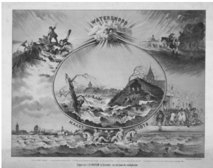
De eerste gedenkplaat.