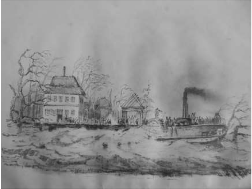
Afbeelding uit een schetsboek souvenir watersnood 1876 - Jan Kuijpers

Het huis is naderhand waarschijnlijk door een brand verwoest en in 1885 volledig afgebroken.