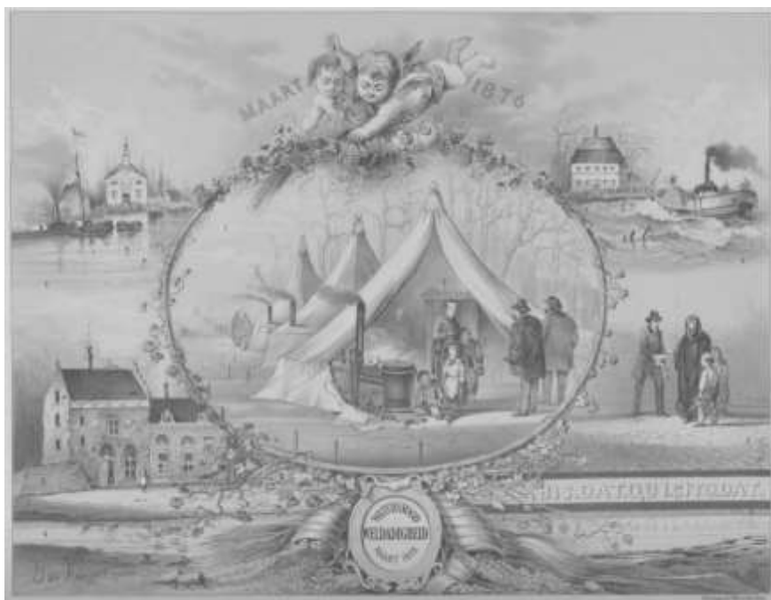
De tweede gedenkplaat

De prenten uit 1876 zijn niet de enige die na een watersnood verschenen. Ook tijdens de watersnood van 1861 werden “weldadigheidsprenten” uitgebracht ten bate van watersnoodslachtoffers. Op de litho van C.C.C. last werden diverse beelden uit de in januari 1861 overstroomde Bommelerwaard afgebeeld. Het herstellen van de doorgebroken Lekdijk in Vreeswijk in 1624 werd vastgelegd door E. van de Velde. Toen in 1809 de dijk bij Nijmegen doorbrak vanwege de vele ijsschoten in de rivier, maakte J. de Vletter daar een afbeelding van. C. de Jonker tekende in 1799 een gevecht op de dijk tegen het kruierend ijs dat de bekisting dreigt te vernietigen.