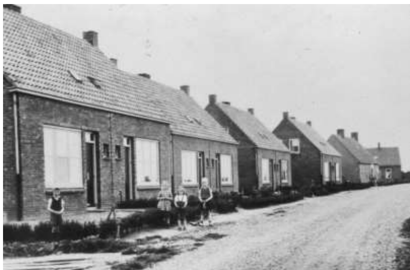
Ook aan de Maarten van Rossumweg werd nieuwbouw gepleegd.

Rond de kerstdagen van 1944 werd de verzetsstrijder Adrianus van Zee onder Veer gevangen genomen. Op 8 maart 1945 werd hij gefusilleerd in fort De Bilt, als wraak voor de aanslag in de nacht van 6 op 7 maart op de Duitse SS-officier Hanss Albin Rauter bij de Woeste Hoeve. Hij werd eerst begraven op een begraafplaats in Utrecht en op 5 juli van dat zelfde jaar vond de herbegravenis plaats in Poederrijen.