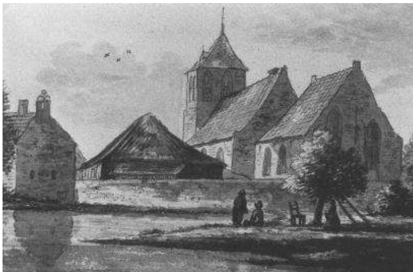
Tekening van de kerk van Poederloij voor de brand van 1897.

Het kerkgebouw was in 1836 geheel vernieuwd, maar zestig jaar later, op 13 juli 1897, brandde de kerk geheel uit, ook de toren leed schade, van de spits bleef niet veel over. Met de brand is veel historisch materiaal verloren gegaan. Terwijl tijdens de brand van mei 1864 de kerk gespaard bleef, restte na de brand van 1897 niet anders dan wat puin en as.