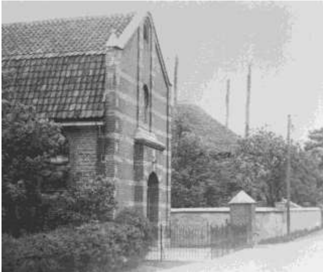
De Gereformeerde kerk aan de Molenstraat met de voorgrond de pomp.

Op 18 september 1895 werd door Burgemeester en Wethouders van de gemeente Zuilichem in het gemeentehuis van Zuilichem bij inschrijving aanbesteed het maken van een gemeentepomp, t.w. het slaan van een nortonpijp, met put, pomp enz. In bestek en voorwaarden staan o.m. beschreven om een ijzeren pijp met stalen puntstuk tot zodanige diepte in te drijven dat zuiver drinkwater in voldoende hoeveelheid wordt verkregen. Tevens moet een loden zuigbuis aangebracht worden t.b.v. de brandspuit. Voor de inwoners van Zuilichem was het plaatsen van deze eerste gemeentepomp een flinke vooruitgang wat de drinkwatervoorziening betrof. Voorheen was men altijd aangewezen geweest op sloten, of zelfs de rivier, om het drinkwater te betrekken, enkele meer gegoede inwoners van het dorp niet meegeerekend, welke meestal zelf wel een geslagen pomp konden bekostigen. Men had besloten om de pomp te plaatsen in de straat voor de Gereformeerde kerk.