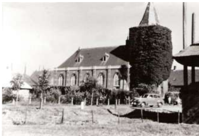
De toren begroeid met klimop voor de restauratie.