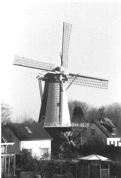
Korenmolen "De Hoop".