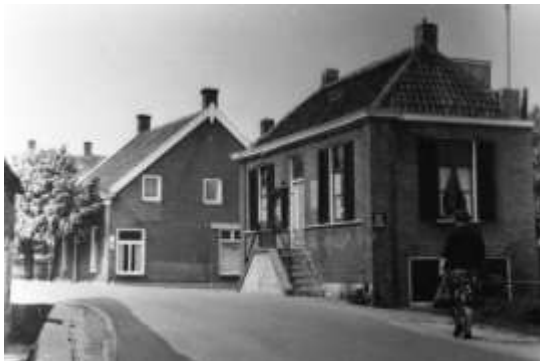
Het oude gemeentehuis van Zuilichem.

Thans verzoek ik de aangewezen meisjes het kleed te verwijderen. De beide meisjes trokken de gemeentevlag van de gedenksteen en gelijktijdig werd de fontein in werking gesteld, waarop de burgemeester de fontein in gebruik genomen verklaarde. Hierop werd door de zangvereniging nog een zangnummer ten gehore gebracht waarna de muziekvereniging het Wilhelmus speelde dat uit volle borst werd meegezongen”.