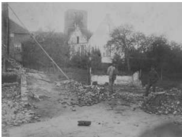
De kerk na de brand in 1897.

Het kerkgebouw was in 1836 geheel vernieuwd, maar zestig jaar later, op 13 juli 1897, brandde de kerk geheel uit, ook de toren leed schade, van de spits bleef niet veel over. Met de brand is veel historisch materiaal verloren gegaan. Terwijl tijdens de brand van mei 1864 de kerk gespaard bleef, restte na de brand van 1897 niet anders dan wat puin en as.