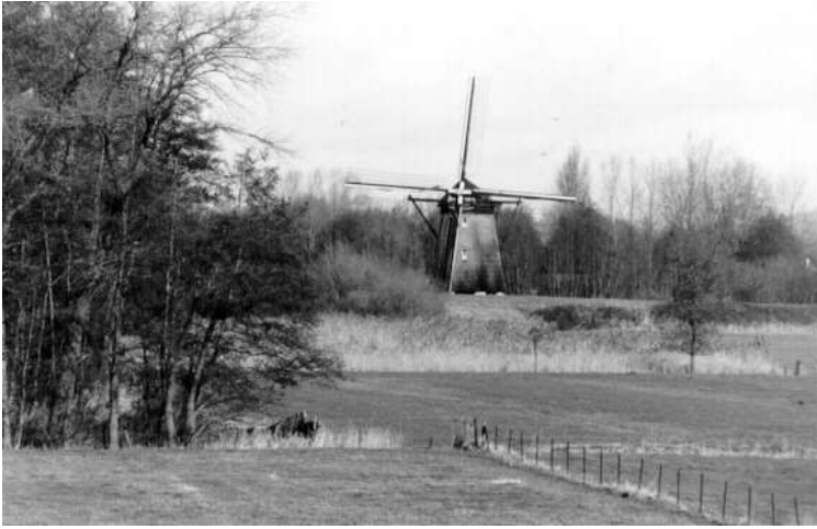
“De Daggelder molen” werd gebouwd in 1720/21.

Volgens de achttiende eeuwse dijkrecht deskundige Cox zijn de in de 15 e eeuw uitgevonden windmolens vanaf begin 16 e eeuw in de Bommelerwaard in gebruik genomen, zij het met wisselend succes. Op een oude topografische tekening uit 1630, van de heerlijkheid Zuilichem, getekend door de landmeter Manteau, in opdracht van Constantijn Huygens, staat reeds een watermolen aangegeven aan de Meidijk op exact dezelfde plaats waar de tegenwoordige molen nog staat, zeer waarschijnlijk zal daar de eerste molen wel gebouwd zijn rond 1530/1540, volgens beschrijving in het boek “Tieler en Bommelerwaarden 1327-1977”. Over het wel en wee van de molen in de negentiende eeuw is niet zoveel bekend. In 1820 wordt als molenaar genoemd Herman Schaap. Na hem hebben drie generaties Daggelder op de molen geleefd en gewerkt t.w. Jan Daggelder (*1821-†1897), Leendert Daggelder (*1862-†1946) en Jan Daggelder, (*1911-†1986). Daarom wordt deze molen nog wel eens “De Daggelder molen” genoemd, en terecht. In 1935 is de molen, toen eigendom van de dorpspolder Zuilichem boven de Meidijk, gerestaureerd en van een nieuwe rieten kap voorzien. Na de restauratie in 1970, welke echter niet voldeed, is de molen op 22 oktober 1991, na enkele jaren te hebben stilgestaan, opnieuw na een grondige restauratie te hebben ondergaan weer in gebruik genomen. De molen is tot 1950 in dienst geweest voor de waterhuishouding.