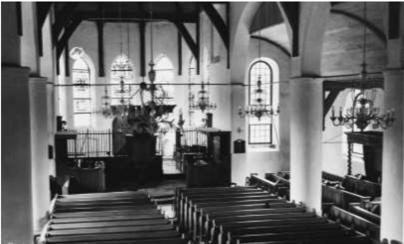
Interieur voor de restauratie van 1980.

In 1980 is het interieur gerestaureerd en zijn de kerkbanken vervangen, ook is de vloer toen door natuurstenen plavuizen voorzien en is er centrale verwarming aangelegd. De herenbank is in die tijd bij een brand bij de restaurateur verloren gegaan. In 1995 is op de kerk een nieuw leien dak gelegd.