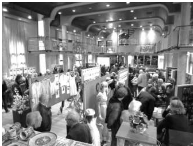
Het was een drukte in Huis Brakel.

Ook de foto’s van de verdwenen dijkhuizen uit het boekje van Lena Dijkhof en een film uit 1966 werd permanent vertoond. Speciaal voor deze tentoonstelling waren foto’s uitvergroot van de verbouwing van Huis Brakel. De foto’s gaven een aardig beeld van de restauratie. Uiteraard waren alle fotoboeken en de krantenknipsels van Brakel uit de verzameling in te zien.