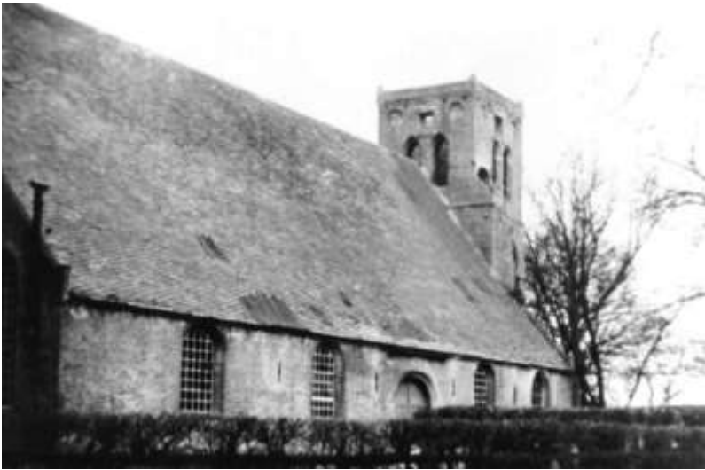
De beschadigde kerk direct na de Tweede Wereldoorlog.

In 1980 is het interieur gerestaureerd en zijn de kerkbanken vervangen, ook is de vloer toen door natuurstenen plavuizen voorzien en is er centrale verwarming aangelegd. De herenbank is in die tijd bij een brand bij de restaurateur verloren gegaan. In 1995 is op de kerk een nieuw leien dak gelegd.