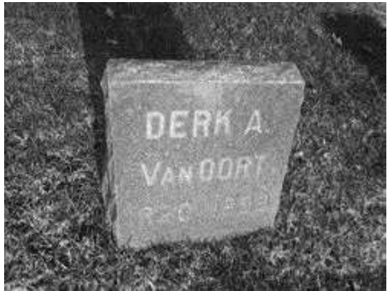
Pilgrim Home Cemetery, Holland, Michigan.