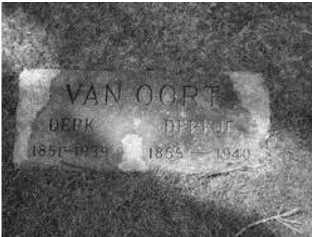
Pilgrim Home Cemetery, Holland, Michigan.