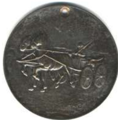
Penning boerenwagendag Brakel 1954

Toch waren er inde jaren 40 al mensen die inzagen dat dit cultureel erfgoed moest worden bewaard voordat ze totaal verdwenen was. Een groep boerenwagen enthousiasten verenigden zich en richtten in het najaar van 1942 de boerenwagenclub op. Zij brachten alles wat met de boerenwagens te maken had en nog voorhanden was bijeen in het Boerenwagen Museum in Buren dat drie jaar geleden helaas is opgeheven. Ook organiseerden zij boerenwagen dagen tijdens de jaarlijkse bijeenkomsten. Zo ook op 19 juni 1954 was dat in Brakel het geval. Na een koffietafel op het Huis Brakel bij de fam. Van Dam te hebben genoten en een rondleiding op het landgoed met een bezoek aan de ruïne van het kasteel Brakel en het Spijker te hebben gebracht, werd de schouw afgenomen van de opgestelde boeren wagens, die werd opgeluisterd door de fanfare OBK. Op het marktplein voor de kerk stonden toen 13 boerenwagens uit Brakel en omstreken opgesteld. Er werden prijzen uitgereikt voor de mooiste boeren wagen. De gelukkige winnaars waren : 1 e prijs H. van Zanten Brakel, 2 e prijs A.J. van Brakel uit Zuilichem, 3 e prijs C.A. Vervoorn uit Brakel. In 1964 bleek er van die 13 wagens nog maar 1 in het dorp aanwezig te zijn.