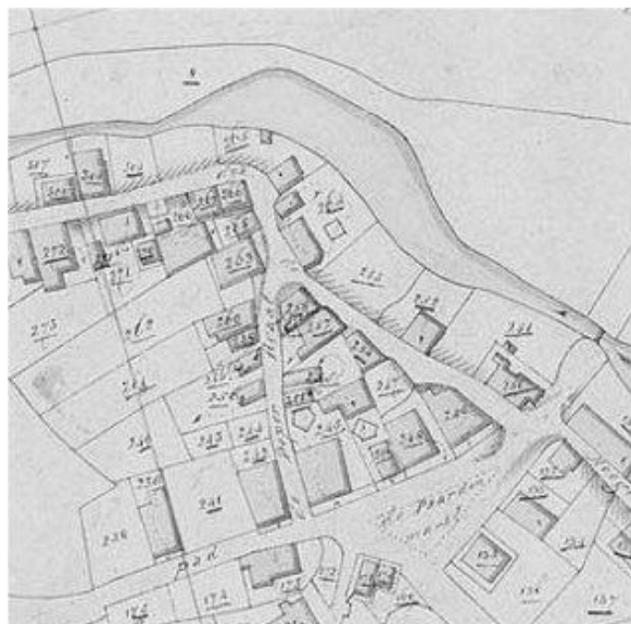
De Peperstraat op het minuutplan van 1823