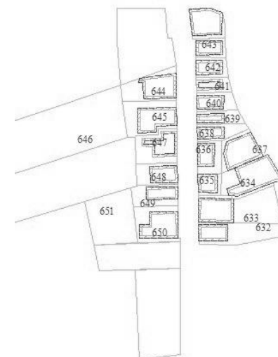
Schets hulpkaart uit 1837

Bij het doorzoeken van verschillende notariële archieven trof ik geen akte aan, die duidt op de aanleg van de Nieuwstraat. Ook de notulen van de gemeenteraad of de aantekeningen van de burgemeester gaven mij geen uitsluitsel over de geboortedatum van de Nieuwstraat.