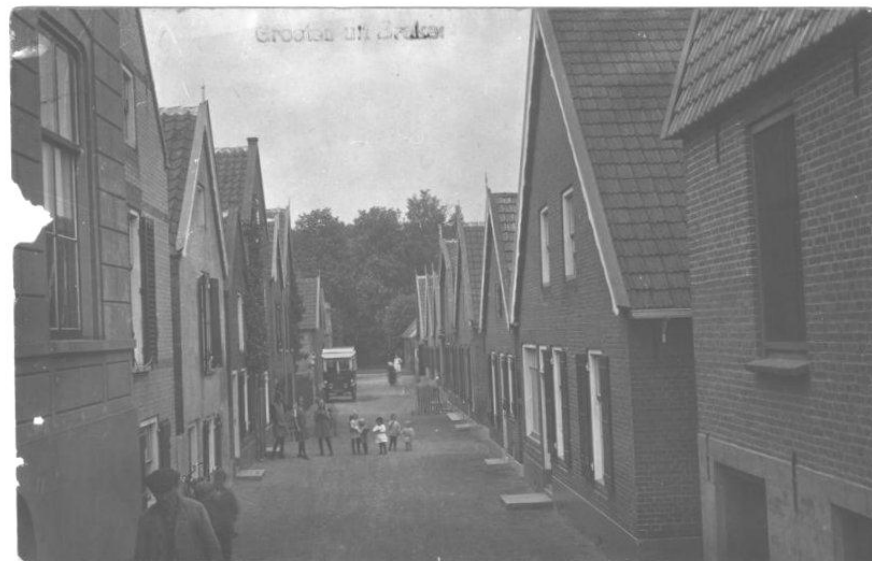
De Nieuwstraat omstreeks 1920

In de residentie van de stichting De Vier Heerlijkheden te Brakel, de koetsierswoning, is op een luchtfoto de plaats van de aansluiting van de Peperstraat op de Waaldijk nog duidelijk te herkennen.