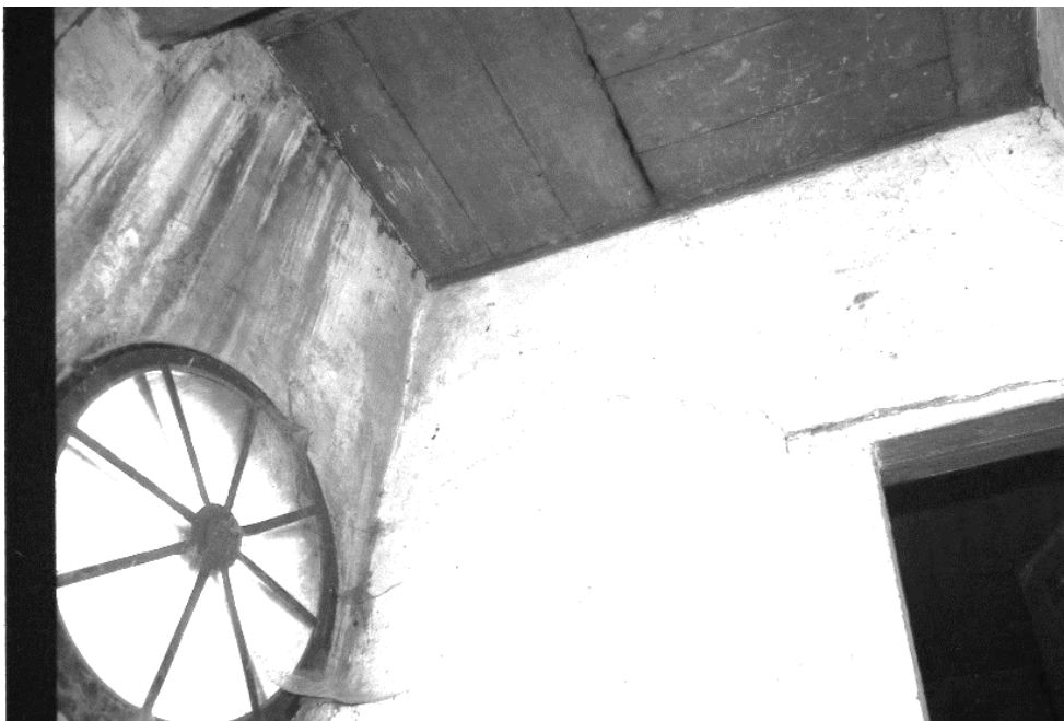
Het luik in de zolder van Het Spijker.

Tot zover het door Maarten W. Schakel vertelde verhaal over de angstige momenten in Brakel in oktober 1944.