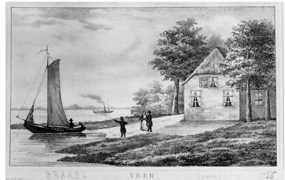
Het veer bij Brakel 1856. Litho: J. H. Heyden. Steendruk: F. Böger. (Gemeentemuseum Arnhem)

Not. Arch. notaris H van Dieden te Ammerzoden. Arch. 182/10 – akte 26.