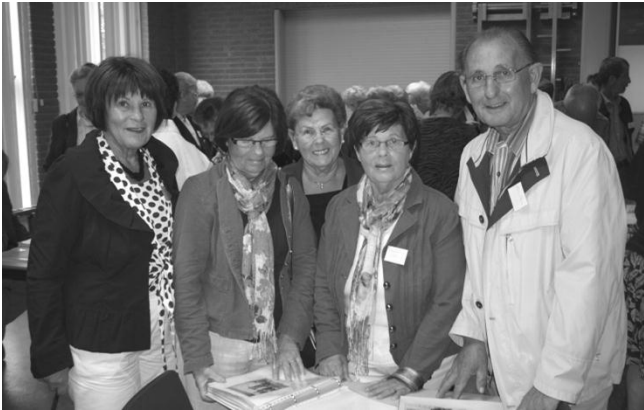
Bijbel op 16 mei.

Op 16 mei waren we met de fotoboeken van Zuilichem te gast bij de School met de Bijbel, waar die dag een reünie was naar aanleiding van het 100jarig bestaan van de school. De meeste scholen halen die leeftijd niet en zijn om een of andere reden al eerder verdwenen, maar die in Zuilichem bleef bestaan.